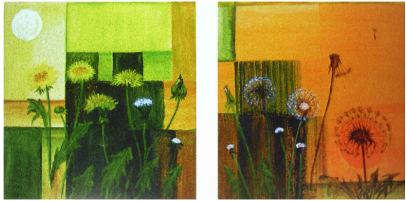
„Die Jahreszeiten ... und mehr“

Telefon: 031 924 20 20 E-Mail: info@aespliz.ch Internet: www.aespliz.ch